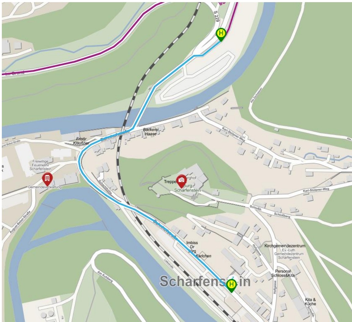
Abb.1: Fußweg (blau markiert) vom Bahnhof Scharfenstein zur Haltestelle Scharfenstein Burgparkplatz

Umstieg zur Buslinie 238 Richtung Ehrenfriedersdorf